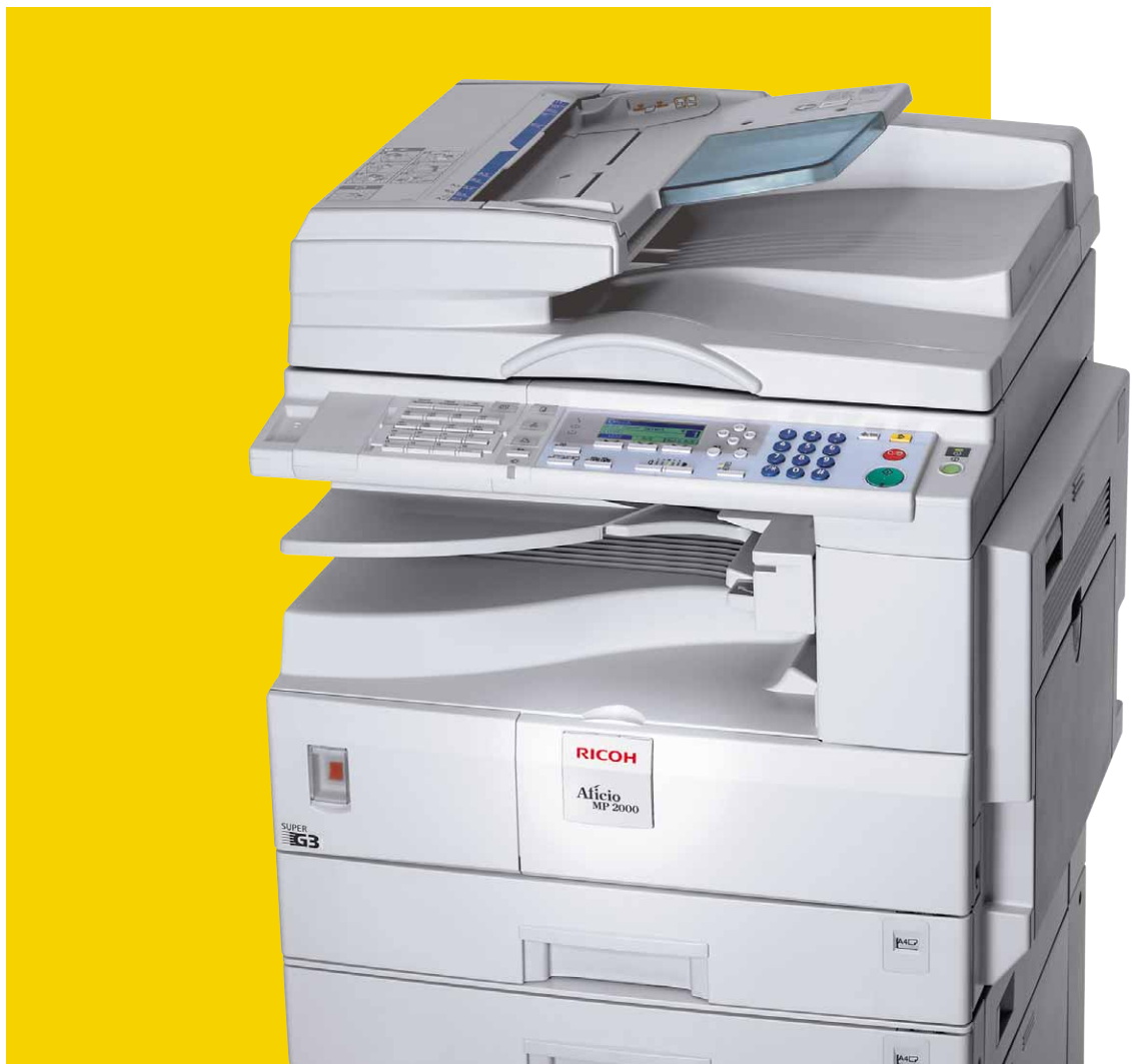
Aficio™ MP 1600/MP 2000