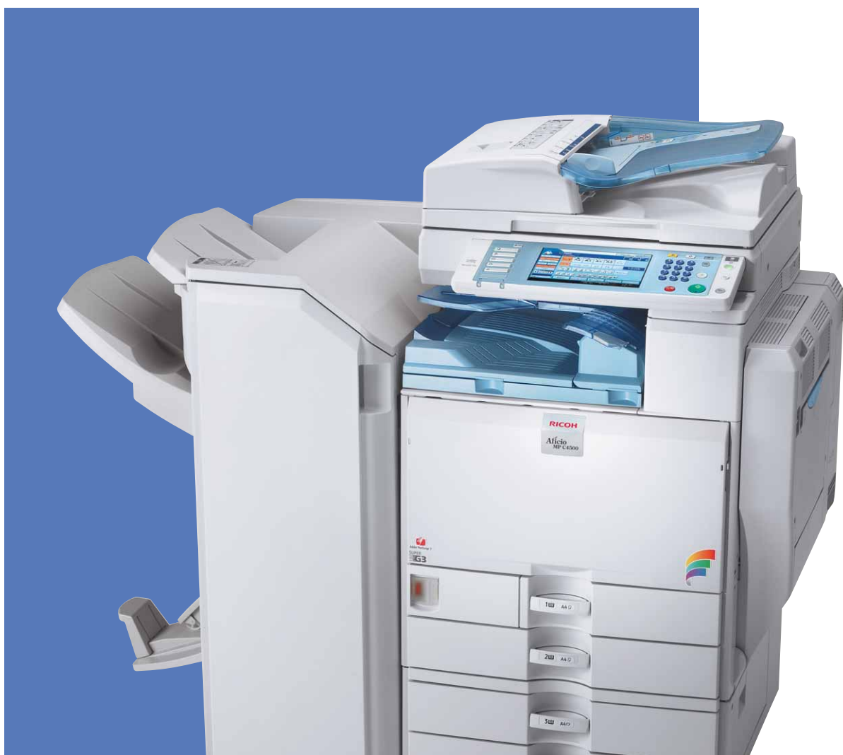
Aficio™ MP C3500/MP C4500

Wyjątkowe, wielofunkcyjne urządzenie: zarówno czarno-białe jak i kolorowe!