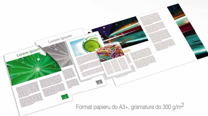
Format papieru do A3+, gramatura do 300 g/m 2

Aficio™MP C6000SP/MP C7500SP obsługuje różne media, co jest szczególnie ważne przy tworzeniu różnego typu raportów, materiałów szkoleniowych czy ulotek. Bez oporów urządzenie akceptuje papier A3+, gramaturę 300 g/m 2 , czy folię OHP. Nie musimy już magazynować nakładu – możemy drukować prace na bieżąco.