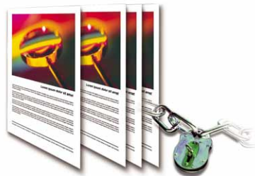
Aby wydruki nie były oglądane przez osoby nieupoważnione, Equitrac Office™ zapewnia podwyższone bezpieczeństwo drukowania dokumentów.