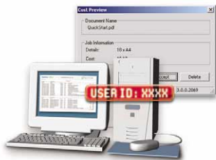
Identyfikacja online oraz podgląd kosztu wydruku.

Equitrac Office™ cechuje się elastyczną architekturą, co służy zaspokojeniu potrzeb różnych środowisk roboczych. Dostępne są dwie wersje oprogramowania: Equitrac Office™ Suite oraz Small Business Edition. Biura, instytucje rządowe, edukacyjne i inne mogą być teraz bardziej wydajne i zmniejszają przy tym koszty operacyjne.