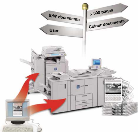
Moduł Rules & Routing pozwala na kasowanie zadań drukowania, wstrzymywanie ich lub przekierowywanie na bardziej optymalne urządzenie.